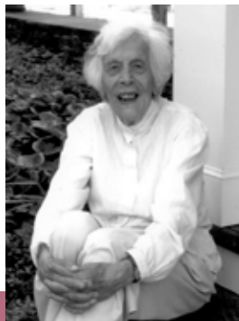
Freya von Moltke