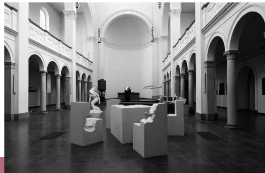
Kunst in der Trinitatiskirche

Sonderführung: So, 17. Juli | 15 Uhr Anmeldung zur Sonderführung bis 15. Juli unter Telefon 0221-20189 135 oder presse@khm.de