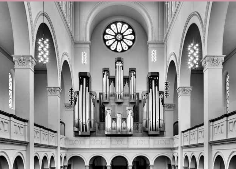
Klais-Orgel in der Trinitatiskirche