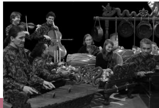
Gamelan Taman Indah

Das Gamelanensemble Gamelan Taman Indah bereichert unsere westliche Musik- und Kulturszene mit der Aufführung von traditionell javanischer, balinesischer und zeitgenössischer Gamelanmusik. Viele Konzertveranstaltungen finden in Zusammenarbeit mit Tänzern, Puppenspielern und Musikern aus Indonesien, Europa und Amerika statt. Mit seinen wunderschönen Originaldekorationen und -kostümen versetzt Gamelan Taman Indah sein Publikum in die Traumwelt Indonesiens. www.gamelanmusik.de