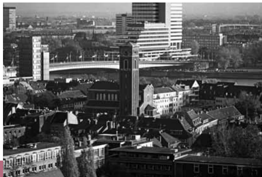
Blick über Trinitatis

Do, 14. bis So, 17. Juli | Eintritt frei, Spende erbeten Veranstalter: Kunsthochschule für Medien Köln