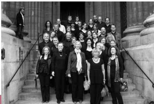
Rheinischer Kammerchor Köln

So, 6. November | 18 Uhr | ca. 1,5 Std. | 9,- € / 16,- € / 27,- € / 32,- €