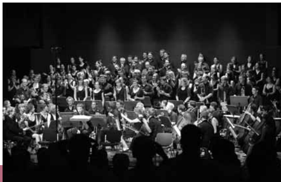
Chor und Orchester der Universität zu Köln

Premiere Fr, 11. Februar | weitere Aufführungen: Sa, 19. Februar | Fr, 25. Februar | So, 27. Februar | Sa, 19. März | Do, 24. März | Sa, 26. März | Sa, 2. April | jeweils 19.30 Uhr – nur Sonntag 18 Uhr 50,60 € | Veranstalter: Oper Köln