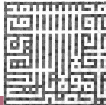
»Labyrinth« von Andreas Ismail Mohr

Seminarkarte für die gesamte Tagung (Freitag bis Sonntag): 90,- € / ermäßigt 70,- € Tages- und Einzelvortragskarten erhältlich. Näheres im Prospekt der Melanchthon-Akademie, Telefon 0221-931803-0 oder unter anmeldung@melanchthon-akademie.de