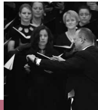
reger chor köln