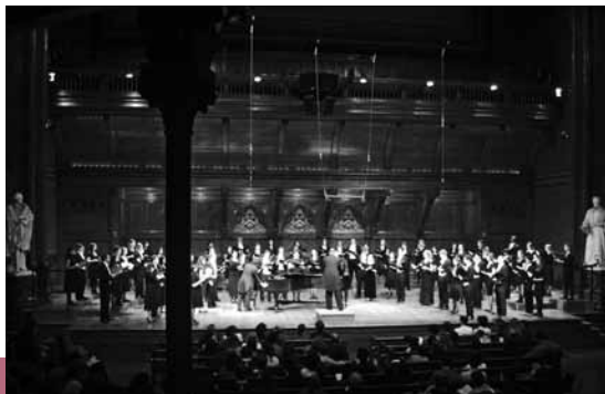
Harvard-Radcliffe Collegium Musicum

Sa, 2. Juli | 18 Uhr | 1,5 Std. | 15,- € / 9,- € (ermäßigt) Veranstalter: Taman Indah in Zusammenarbeit mit der Evangelischen Kirchengemeinde Altenberg