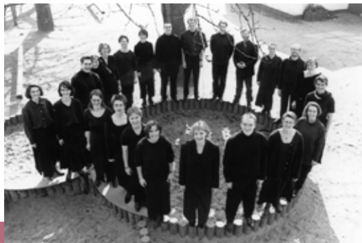
Collegium Cantorum Köln

Sa, 8. Oktober | 19.30 Uhr | ca. 2 Std. | 20,- € / 14,- € (ermäßigt)