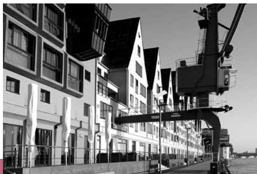
Rheinauhafen in Köln

So, 17. Juli | 15 Uhr | 1,5 – 2 Std. | 8,- € / 6,- € (ermäßigt) Veranstalter: AntoniterCityTours – Evangelische Gemeinde Köln