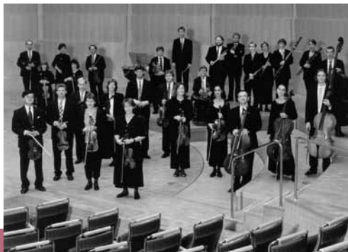
Rheinisches Kammerorchester Köln

So, 27. März | 18 Uhr | ca. 1,5 Std. | 15,- €