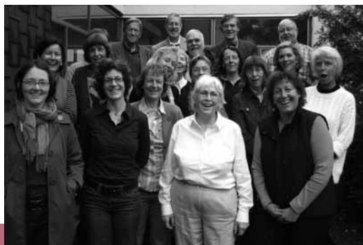
Madrigalchor Köln Klettenberg

So, 16. Oktober | 18 Uhr | ca. 1,5 Std. | 15,- € Veranstalter: reger chor köln e.V.